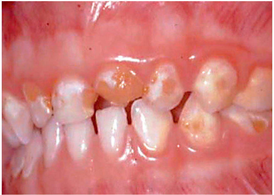
Abbildung 2: Nuckelflaschen-Karies an den Frontzähnen [26].

Die Beikost kann selbst gekocht oder gekauft werden. Bei selbst hergestellter Nahrung können die Eltern die Zutaten selbst auswählen und auf die Verwendung von Salz und Zucker verzichten. Außerdem wird eine hohe Variationsbreite bei Geschmack und Textur erreicht. Studien haben ergeben, dass dies die Akzeptanz für bisher dem Kind nicht bekannte Lebensmittel erhöhen kann [22]. Industriell gefertigte Nahrung hat den Vorteil, dass sie hohe gesetzliche Anforderungen erfüllen muss und dass sie wenig zeit- und arbeitsintensiv zubereitet werden kann. Bei Fertigprodukten sollten Produkte bevorzugt werden, die sich an Rezepten von selbstzubereiteten Speisen orientieren. Stark gesalzene, gewürzte oder gesüßte Produkte sollten nicht verabreicht werden. Vermieden